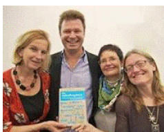
Das Autorenteam auf der BUCH WIEN

Sigmund Freud Museum - Buchleseerlebnisabend mit Aufstellung (Essenz, ca. 12 Minuten), 22.10.2012: http://youtu.be/g_TuH-v-z94